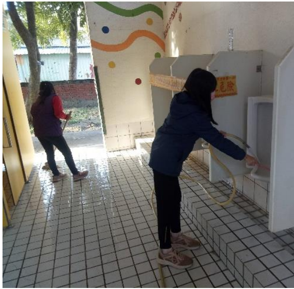
說明：我會做好打掃工作維護校園環境衛生