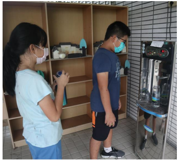
說明：我會每天喝足白開水