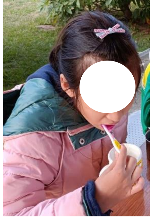
說明：我會三餐及睡前刷牙