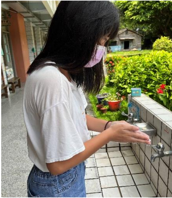
說明：我會正確的洗手